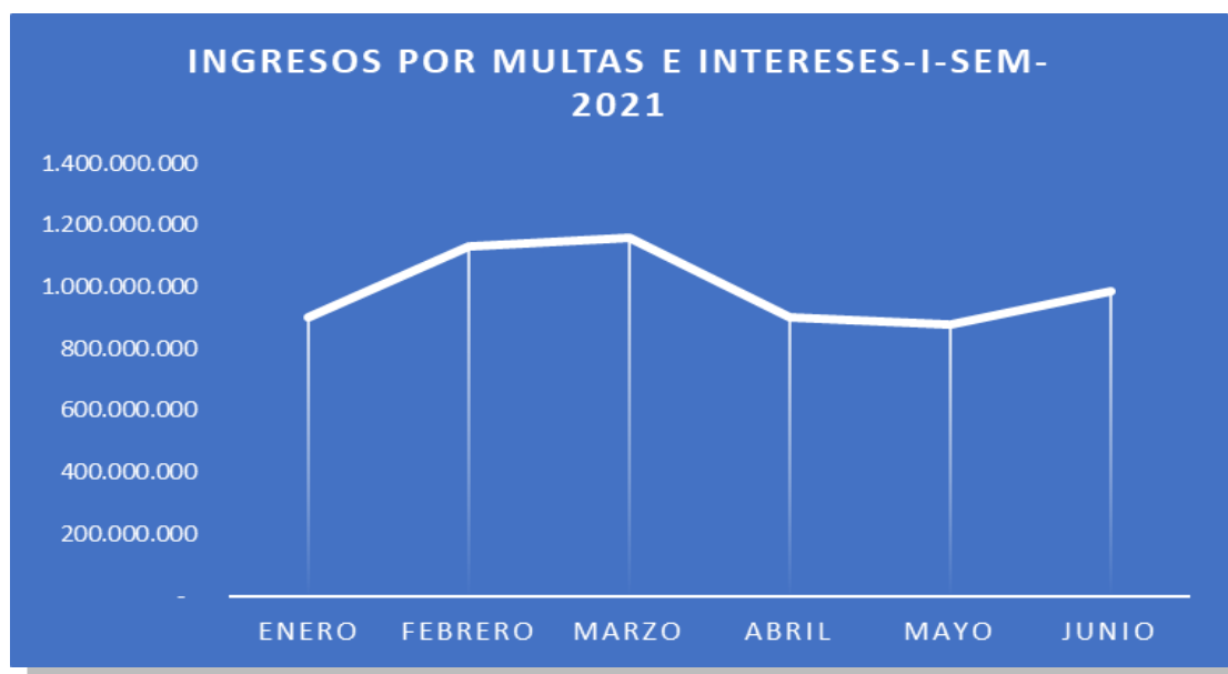
Gráfico No 3. Ingresos por multas, sanciones e intereses de mora ejecutados en el primer semestre de 2021

A continuación podemos observar el comportamiento del recaudo, los cuales fueron crecientes en el primer trimestre, con un segundo pico en el mes de junio, se espera que en el segundo semestre de 2021 se presenten como mínimo dos picos de recaudos para cumplir con la meta esperada.