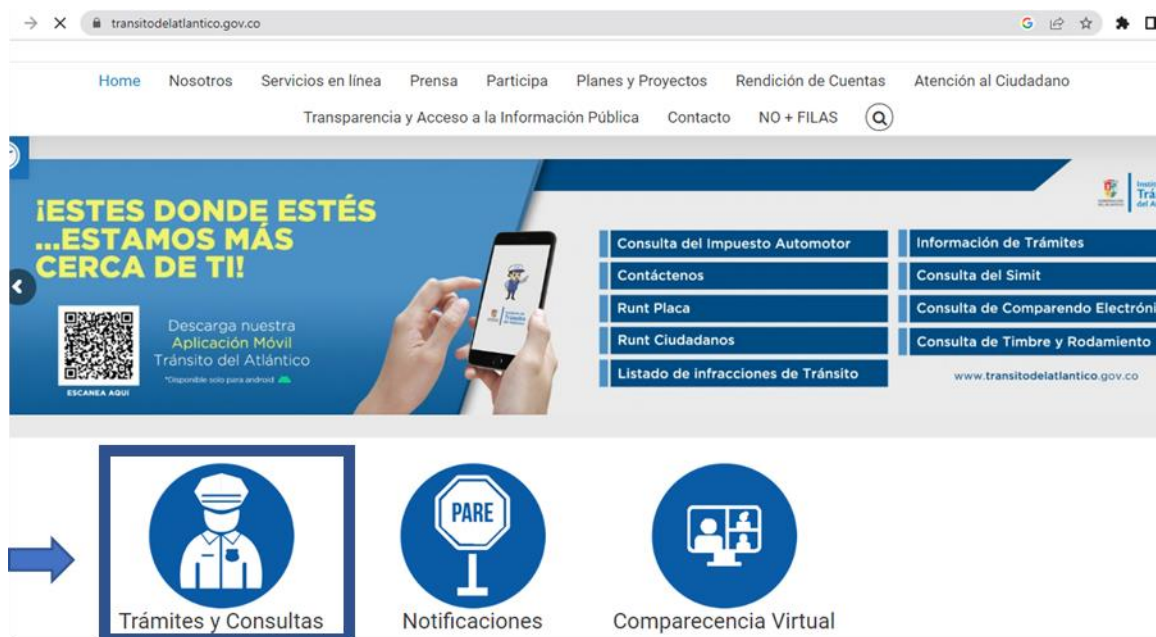
Figura 8. Portal de Tramites de la Pagina Web de la Entidad

En el marco de la Estrategia de Racionalización de Trámites del Instituto de Tránsito del Atlántico, frente al mejoramiento del servicio prestado y facilitación del acceso a los trámites ofrecidos a los ciudadanos, en la Página Web de la entidad https://transitodelatlantico.gov.co/ contamos con el botón de tramites el cual debe ser actualizado una vez que se apruebe el MANUAL DE TRAMITES DEL ITA.