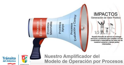
Figura 4: Amplificador del Modelo de Operación por Procesos

En el ITA hemos querido tomar los lineamientos establecidos por varias metodologías como la de la Función Pública, Normas Nacionales e Internacionales como lo es la ISO 31000 y la misma establecida por el COSO III – ERM, de las cuales con el apoyo de nuestro talento humano y un asesor experto en temas de Gestión de Riesgo se adoptó la metodología para la administración de riesgos y el diseño de controles, la cual se puede ver en el documento MANUAL OPERATIVO PARA LA ADMINISTRACIÓN INTEGRAL DEL RIESGO que se encuentra en el enlace de Transparencia y acceso a la información.