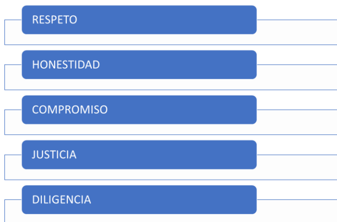
Figura 2: Nuestros Valores del Código de Integridad

Para garantizar una gestión con valores (Figura 2) bajo conductas éticas de nuestros colaboradores y todo nuestro talento humano, lo que buscamos con este plan es fortalecer y aportar a la lucha contra la corrupción y mejorar la transparencia e integridad en el Instituto de Tránsito del Atlántico, es por ello que todo nuestro talento humano asume sus roles y responsabilidades bajo los siguientes principios.