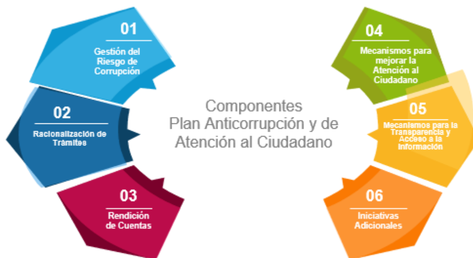
Figura 3: Componentes del PAAC

El Plan es integrado por seis (6) componentes independientes (Figura 3) que cuentan con parámetros y un soporte normativo propio. Además, de acuerdo con lo establecido en el Decreto 1499 de 2017, el PAAC instrumenta los lineamientos del Modelo Integrado de Planeación y Gestión – MIPG y las Políticas de Gestión y Desempeño Institucional que operativamente lo desarrollan, en las dimensiones de Control Interno, Gestión con Valores para Resultados (Relación Estado Ciudadano) e Información y Comunicación. Dichos componentes son: