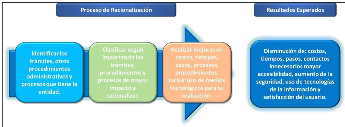
Figura 9. Proceso de mejora a la Racionalización de Trámites propuesto por el Guía para la formulación del PAAC del DAFP