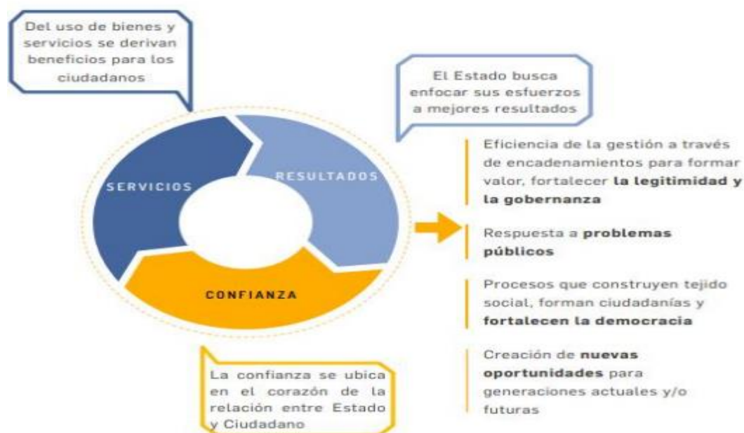
Figura 5. Creación del Valor Público

Además, es un foco central para el rol del directivo público con relación a la responsabilidad que tiene en procesos que efectivamente generen resultados. Se busca pasar de un enfoque burocrático (estructura rígida) a un enfoque iterativo e interactivo que ayude a discernir y definir lo que el ciudadano prefiere y, por ende, lo que genera valor público para él (Plan Nacional de Formación y Capacitación 2020-2030).